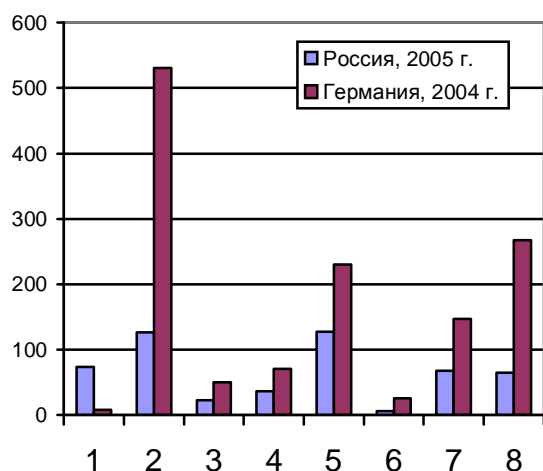
Рис. 1.4. Валовая добавленная стоимость по видам экономической деятельности, млрд. долл.