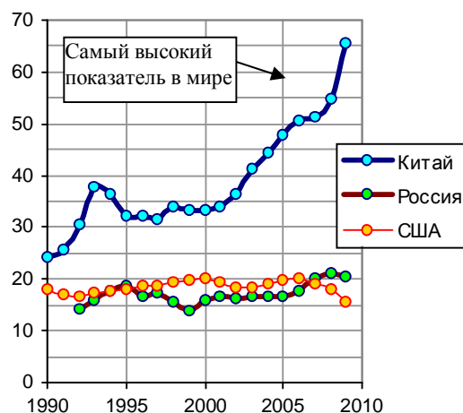
Рис. 1.490, б. Общие инвестиции в основные фонды (Total Investment in Fixed Assets) в процентах от ВВП по данным национальных источников: [I.6, I.7, I.17]; Bureau of Economic Analysis (BEA), National Account; National Bureau of Statistics of China.

Дополнительную информацию и ссылки на источники см. в книге «Российские реформы в цифрах и фактах» на сайте http://kaivg.narod.ru или на сайте http://kaig.ru