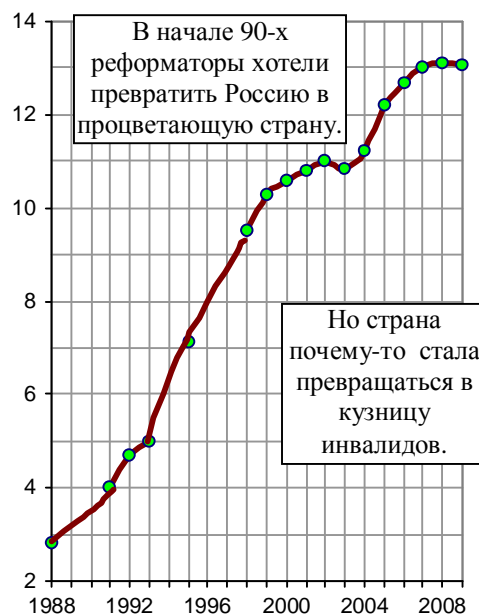
Рис. 3.54. Общая численность инвалидов, млн. чел. (на 1 января соответствующего года).