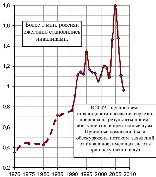
Рис. 3.53. Численность лиц, впервые признанных инвалидами, млн. чел.