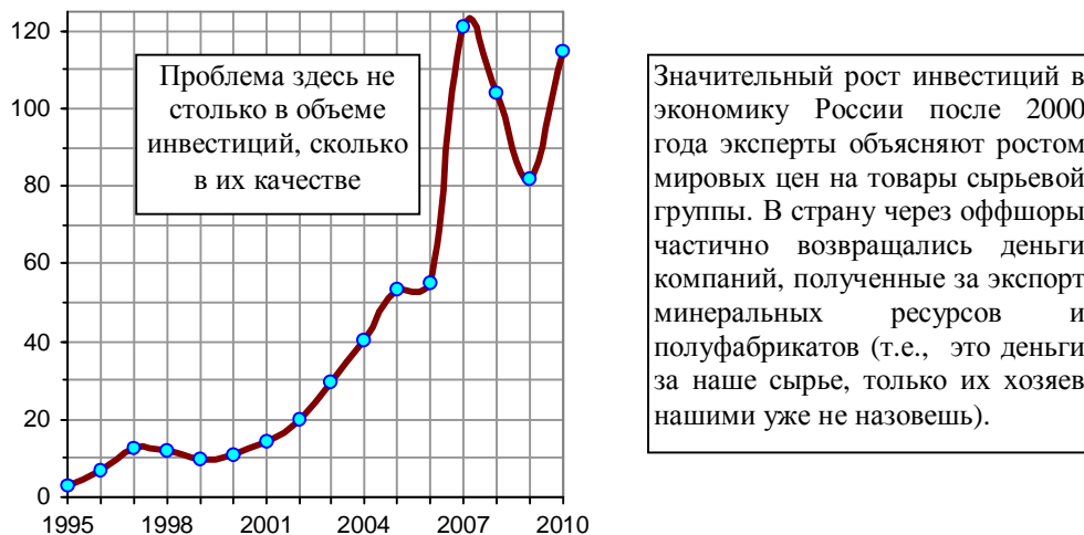
Рис. 1.495. Объем инвестиций, поступивших в РФ от иностранных инвесторов, млрд. долл.

Общий объем иностранных инвестиций в РФ за период 1995 - 2010 гг. увеличился (рис. 1.495). Но этот рост скорее огорчал, чем радовал. Почему? Попробуем разобраться.