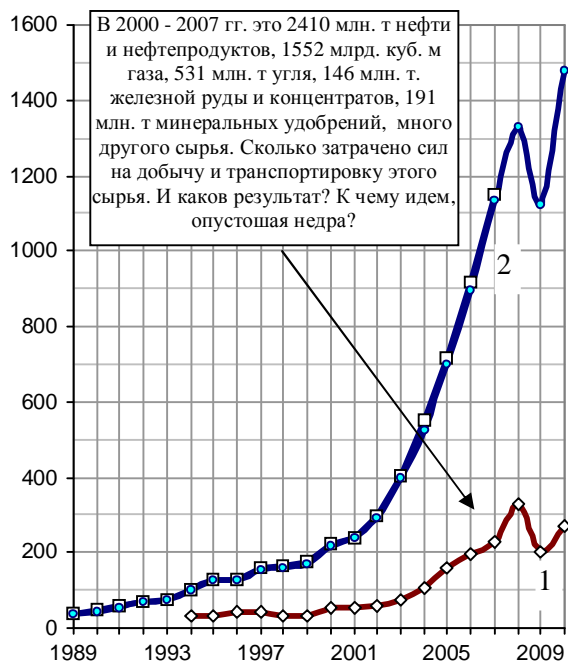
Рис. 1.594. Экспорт минеральных продуктов из РФ (1) и промышленных товаров (manufactures) из Китая (2), млрд. долларов. Источники: [I.6]; National Bureau of Statistics of China; WTO Statistics Database.

Многokратный рост объемов китайского экспорта за последние 15 лет обусловлен успешными реформами экономики, рост же объемов экспорта России в денежном выражении, как уже отмечалось, – в значительной степени успешным ростом цен на товары сырьевой группы и металлы.