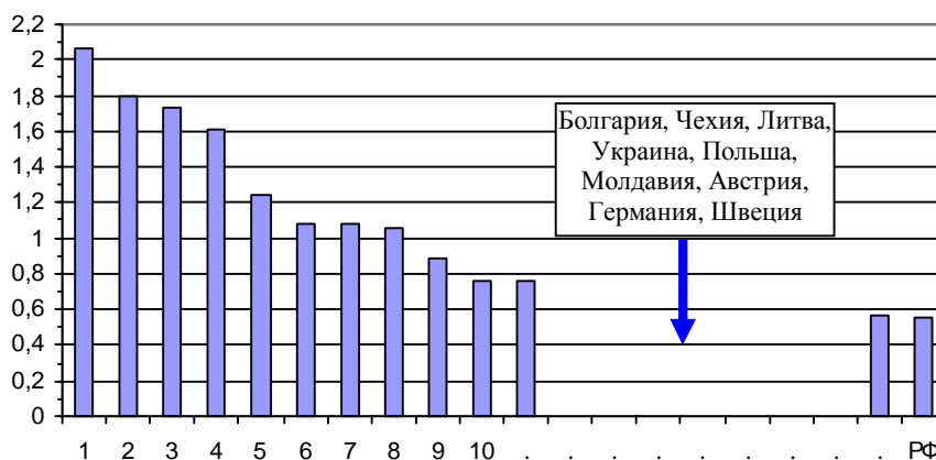
Производство зерновых и зернобобовых на душу населения в некоторых странах мира в 2005 г., тонн/чел. (для РФ и стран СНГ данные за 2006 г.). Источники: [I.6, I.31 – I.33].

Дополнительную информацию и ссылки на источники см. в книге «Российские реформы в цифрах и фактах» на сайте http://kaivg.narod.ru или на сайте http://kaig.ru