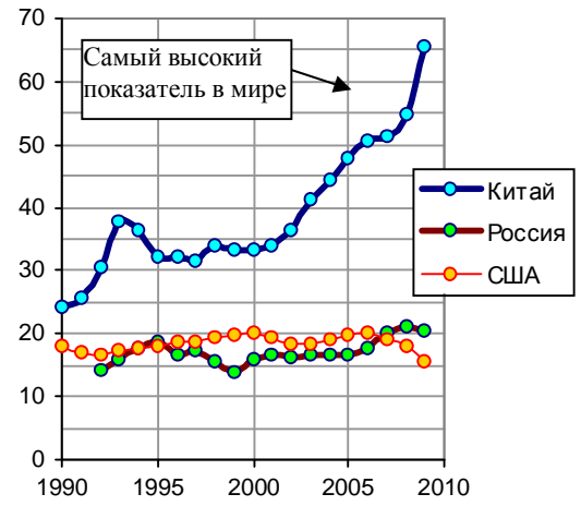
Рис. 1.490, б. Общие инвестиции в основные фонды (Total Investment in Fixed Assets) в процентах от ВВП по данным национальных источников: [I.6, I.7, I.17]; Bureau of Economic Analysis (BEA), National Account; National Bureau of Statistics of China.