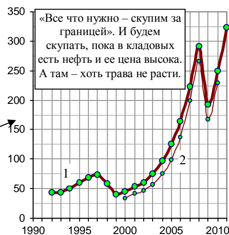
Рис. 1.584. Объем товарного импорта крупнейшими странами – импортерами и Россией, млрд. долл. Источник: WTO, International Trade Statistics, 2000 ÷ 2011.

В.Путин, 11.07.2011: «Мы, слава Богу, или по несчастью, не печатаем резервной валюты, а они-то что творят? Хулиганят просто, станок включают и разбрасывают на весь мир, решая свои первоочередные задачи... США по полной программе используют монополию на печатание денег».