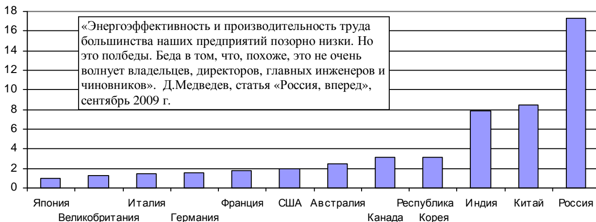
Рис. 1.341. Потребление энергии (в нефтяном эквиваленте) на единицу ВВП в некоторых странах по сравнению с этим показателем в Японии (Япония = 1) в 2005 году.