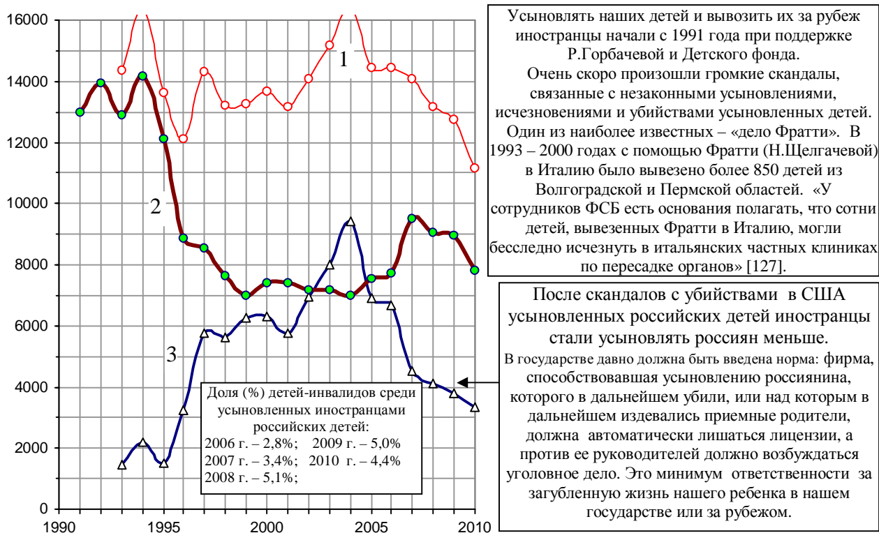
Рис. 2.120. Количество ежегодно усыновляемых российских детей (1), в том числе усыновленных российскими (2) и иностранными (3) гражданами. При построении графика использованы данные [П.6], Национального статистического комитета Республики Беларусь, материалы Минобрнауки РФ и интернет-проекта Минобрнауки РФ «Усыновление в России», www.usynovite.ru .

За 18 лет (1993 – 2010 гг.) за рубеж вывезено около 100 тысяч ненужных государству российских детей. Для сравнения: за 4 года, с 2005 г. по 2008 г., из Республики Беларусь иностранцы вывезли четырёх усыновленных белорусских детей.