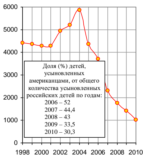
Рис. 2.122. Количество российских детей, усыновленных гражданами США.